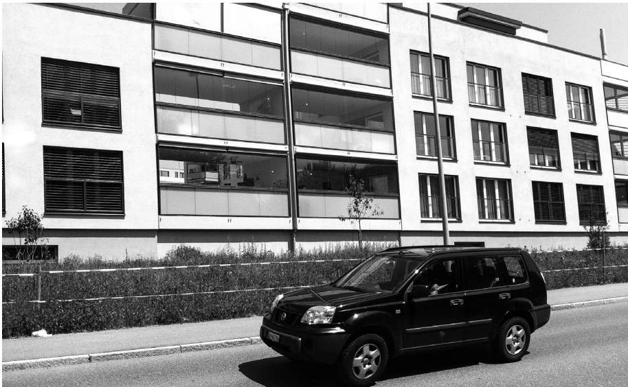
Architektonische Lösung mit Mehrwert: In Fehraltorf ZH wurden zwischen zwei Wohnhäuser verglaste Balkone eingebaut, die als «Lärmschutzwand» dienen – und erst noch einen zusätzlichen Aussenraum bieten.