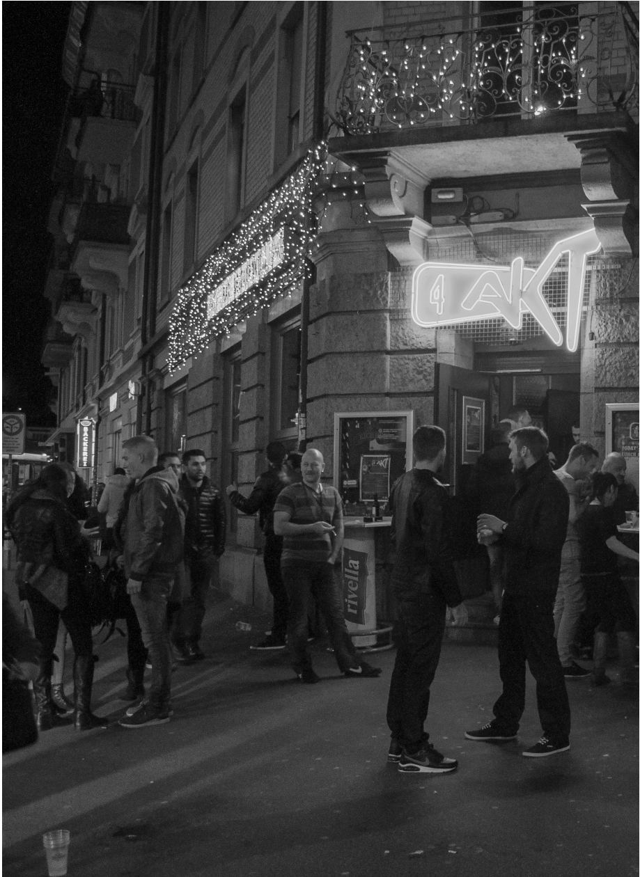
Nachtschwärmer im Ausgehquartier Zürich West, wo gegenwärtig auch viele Wohnungen entstehen. Lärm-Klagen sind hier häufig.