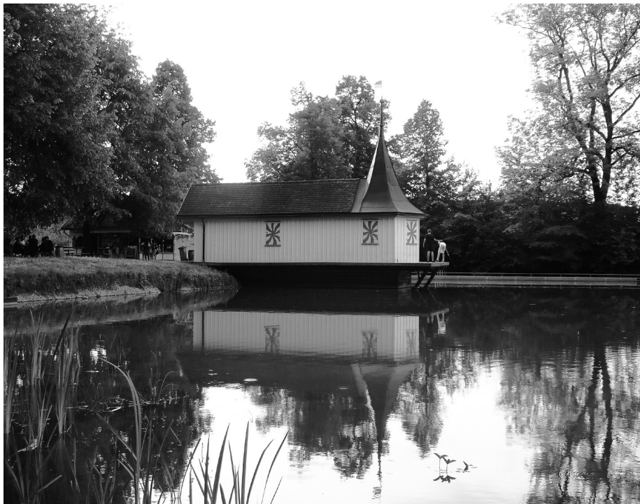
Ruhe-Gebiet in der Stadt St. Gallen: Das Naherholungsgebiet «Drei Weieren» liegt südlich der Altstadt, im Bild der Bubenweiher mit dem Weierhaus aus dem Jahr 1677.