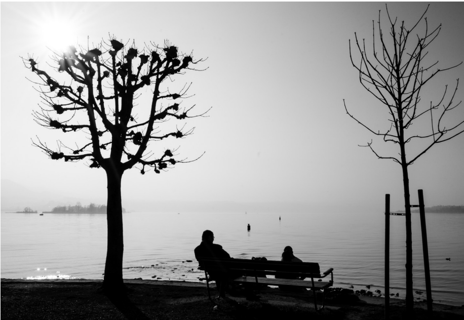
Ruhe-Ort an der Seepromenade von Rapperswil SG.