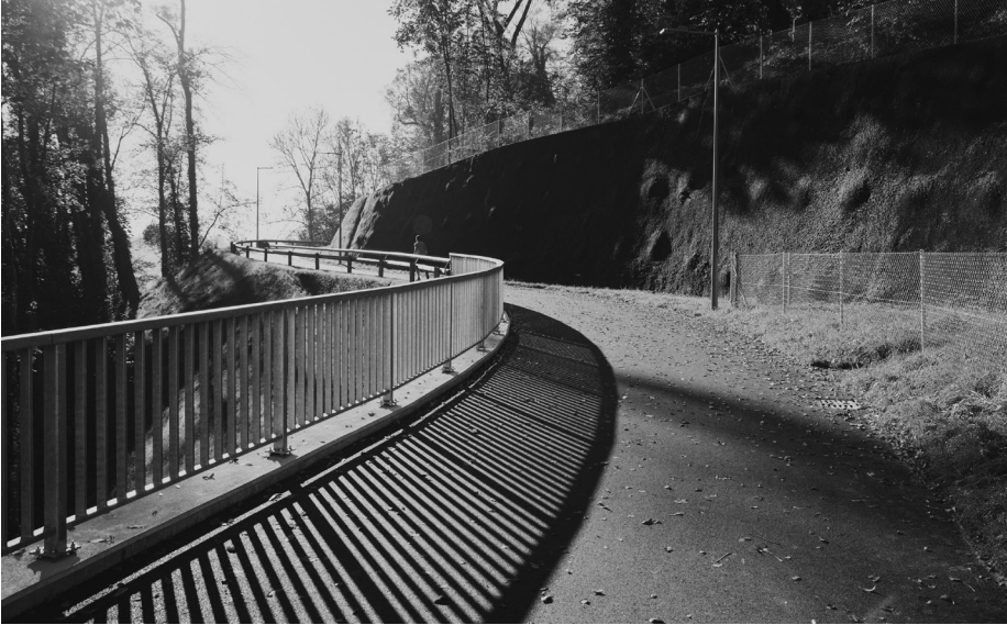
Ruhe-Achse in der Stadt Freiburg: Der Fuss-und Veloweg Palatinat.