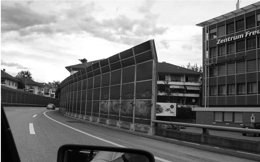
Klassischer Lärmschutz bei Freudenberg in Bern – städtebaulich unattraktiv.