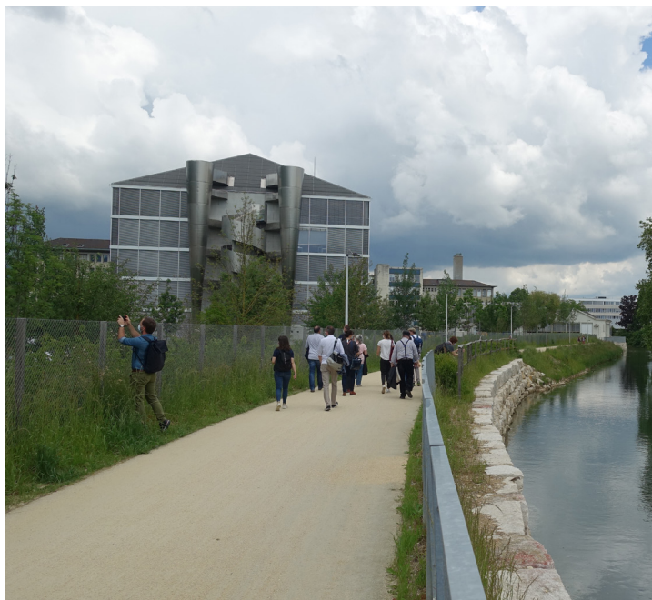
Photo de couverture: îles de la Suze, Bienne