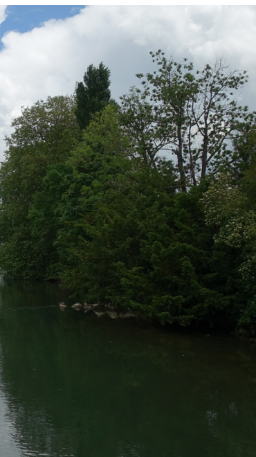
Reflet du séminaire 2021, sur le chemin des Ecluses, Bienne