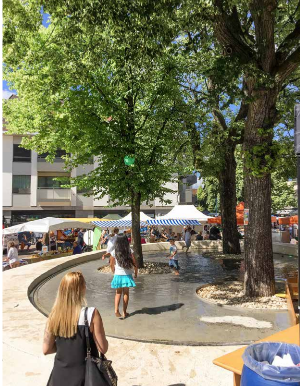
En tant qu'espace de rencontre, le centre de la localité – l'entre-deux – contribue à la qualité de vie à Riehen (BS).