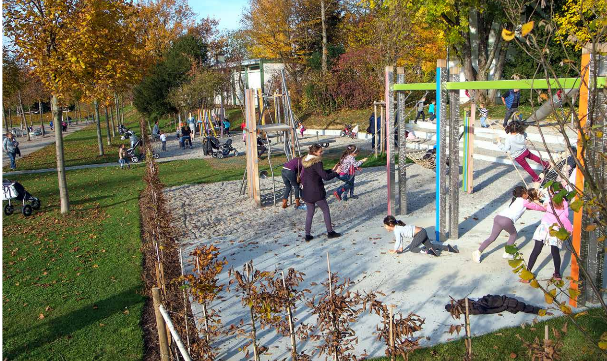
Le parc de Brännengut à Berne est à la fois vaste, vert et varié. La population du quartier s’y sent visiblement bien.

de Brännengut transformé en poumon vert est devenu un véritable carrefour social où l’on joue, se rencontre et se détend (voir l’encadré «Quelques exemples de culture du bâti», p. 8).