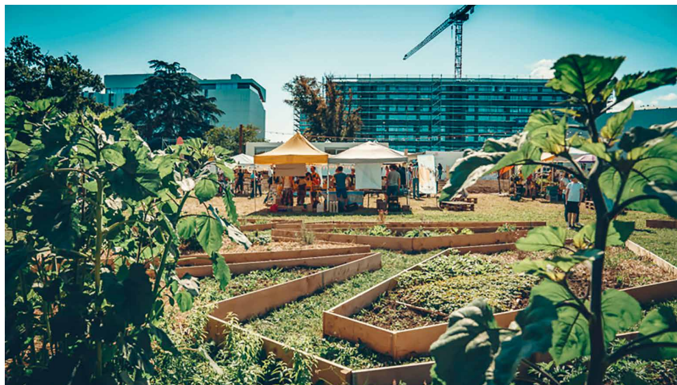
Le canton de Genève utilise la digitalisation notamment pour favoriser des projets durables, comme ici au Jardin des Nations.