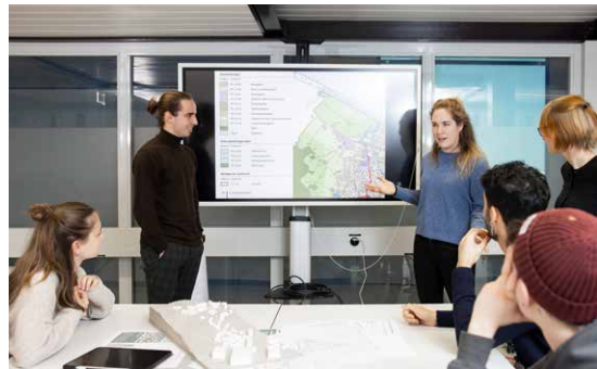
La sensibilisation au thème de la digitalisation est un élément important pour les étudiant-es de la Haute école de Suisse orientale.