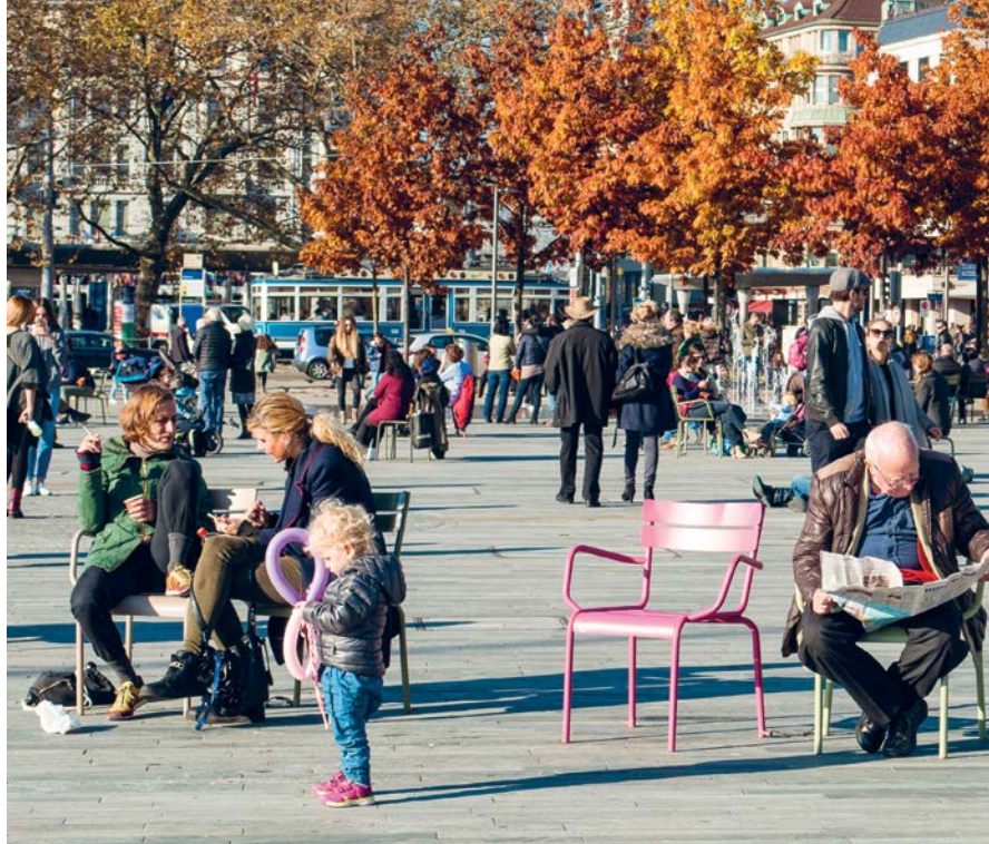
Sechseläutenplatz, Zurich.